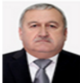
ҚУРБОНИЁН Абдусалом Карим Министр Финансов РТ