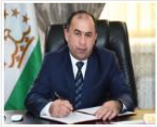
Азими Заъфар Исмоил Заместитель Председателя Счетной палаты Республики Таджикистан