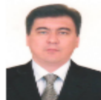
НУРМАҲМАДИЁН Чамшед Заместитель Министра финансов РТ