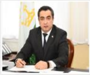
Хаирализода Фаррух Махмуд Председатель Счетной палаты Республики Таджикистан