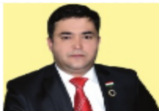
КАРИМЗОДА Чамшед Абдурахмон Первый Заместитель Министра Финансов РТ