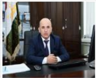
Ахмадзода Файзали Зардак Контроль государственного бюджета, внебюджетных фондов, органов исполнительной власти и государственного управления