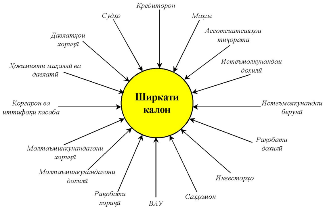
Расми 3. Гурӯҳҳои манфиатдори фаъолияти истехсолии ширкати калон

натичаи меҳнаташон қаноатмандӣ гиранд ва баробари музди хуби меҳнат инчунин роҳбарии хуб, муҳити психологӣ хуби корхонаро интизор мебошанд. Харидорон бошанд сифати хуби мол, нархи нисбатан паст, имкон ба молҳо ва хизматхоро интизор мебошанд