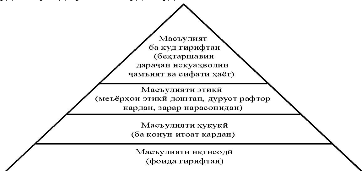
Расми 4. Нишондиҳандаҳои баҳои натиҷаи фаъолияти иҷтимоии ташкилот

Ченаки аввали баҳои масъулияти иҷтимоии корхона - ин масъулияти иқтисодӣ мебошанд. Тамоми ташкилоти тичоратӣ ячейкаи ҷамъиятие мебошанд, ки масъулиятро оид ба истехсоли маҳсулоти зарурӣ ва хизматҳо ва максимизатсияи фоидаи саҳҳомӣ равона месозанд. Мақсади баланди масъулиятнокии иқтисодӣ ин ҳарчи фоидаи зиёд ба даст даровардан мебошад. Иқтисодчии бузург Фридман, асосҳои назариявии ин концепсияро кор карда баромадааст. Вай қайд мекунад, ки фаъолияти ташкилот бояд ба гирифтани фоида итлоат намояд ва вазифаи ягонаи он барои зиёд кардани фоида равона карда шудааст.