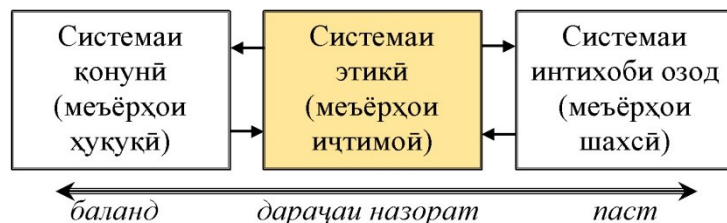
Расми 1. Нишондиҳандаҳои асосии муайянкунандаи фаъолияти одамон ва системаи ташкили меъёрҳо

Масоили этикӣ дар он ҳолате пайдо мешавад, ки агар рафтори як шахси алоҳида, ё умуман ташкилот ба муҳит, атрофиён зарар, ё худ фоида меорад. Барои мисол роли қоидаҳои этикии рафтори шахс ва таъсири меъёрҳои ҳуқуқиро дида мебароем: (Нигаред ба расми 1).